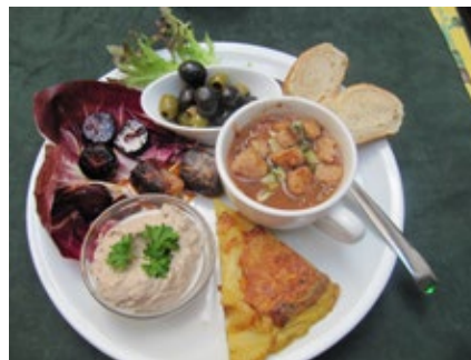
Kulinarisches von hessenESSEN