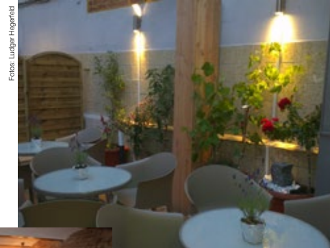
Der Hofgarten im Switchboard