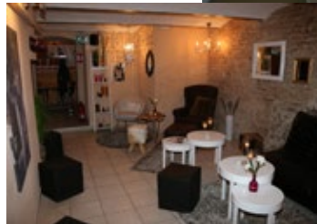
Die Lounge im SWITCHBOARD